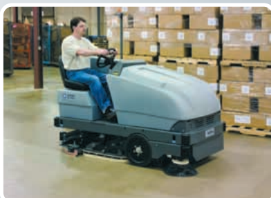
CR1000/XL и CR 1500

Новейшая серия больших поломоечных машин для уборки коммерческих и промышленных объектов